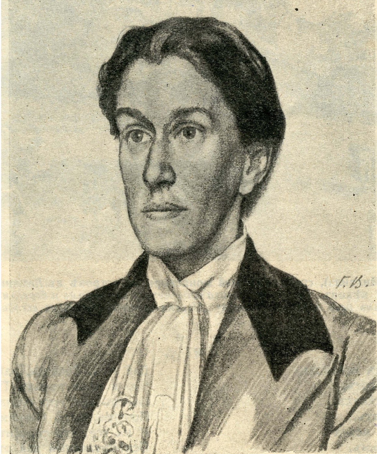
Первая в России женщина-доктор истории Ольга Антоновна Добиаш-Рождественская. Портрет работы художника Г. Верейского.

В наши дни пока что свободного передвижения по Европе, когда величайшие святыни христианства встречают нас благосклонно и с полуторатысячелетним достоинством, у каждого есть возможность выбора. Поэтому можно предварить собственное путешествие тщательным знакомством с книгами и планами маршрутов, составленными странниками и учеными прежнего столетия. Из их числа