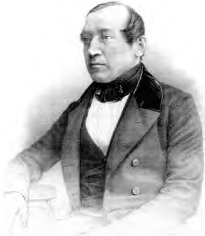
Осип Максимович Бодянский (1808–1877)