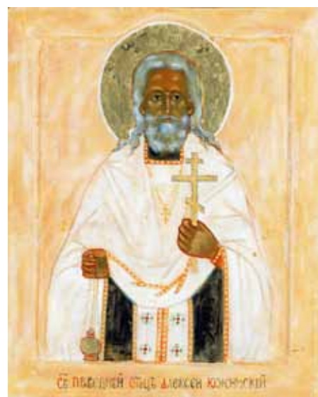
Святой праведный Алексей Южинский. Икона работы Марии Александровны Струве. Покровский монастырь. Bussy-en-Othe