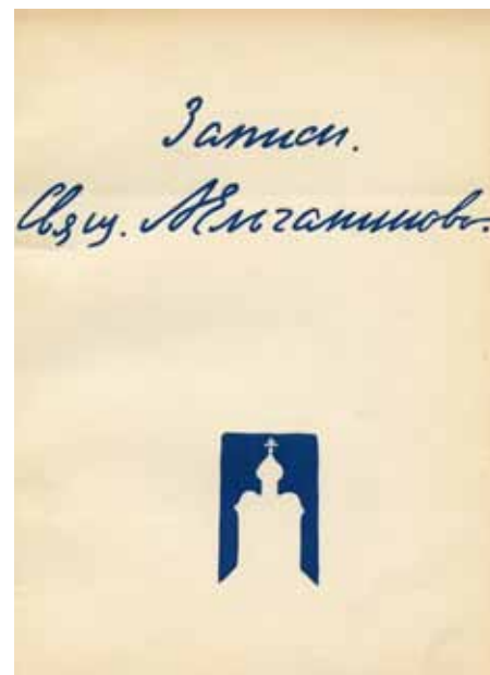
«Записи». Обложка первого издания. Париж, YMCA-PRESS. 1935 год