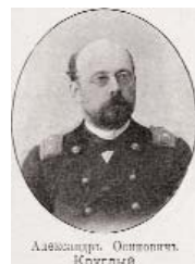
Александр Осипович Круглый.

КРУГЛЫЙ Александр Осипович (12.01.1868, С.-Петербург - 06.04.1922, Петроград). Историк, педагог, библиограф. В 1892 г. окончил историко-филологический факультет Петербургского университета с дипломом 1-й степени с присвоением звания кандидата. В 1895 г. стал одним из организаторов экспозиции книжного