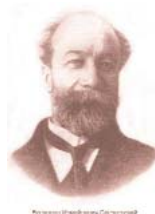
Всёволод Измаилович Срезневский

СРЕЗНЕВСКИЙ Всеволод Измайлович (29.05.1869, С.-Петербург - 29.06.1936, Ленинград). Филолог, специалист в области рукописной книги. Окончил юридический факультет Петербургского университета. Служил в Царской армии. С 1891 по 1893 г. - служащий Императорской публичной библиотеки в Санкт-Петербурге. Сотрудник БАН с 1893 по 1931 г. - был младшим, затем старшим помощником библиотекаря 1-го (русского) отделения центральной библиотеки. С 1901 г. старший ученый хранитель 4-го (рукописного) отделения центральной библиотеки Петербургской академии наук. С 2 декабря 1906 г. член-корреспондент Отделение русского языка и словесности Петербургской академии наук. Организатор первых археографических экспедиций и инициатор создания в БАН фонда нелегальной и запрещенной литературы.