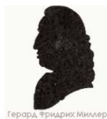
Герард Фридрих Миллер

МИЛЛЕР Герард Фридрих, Федор Иванович (Miller Gerard Friedrich, 29.10.1705, Херфорд, Вестфалия - 11.10.1783, Москва), сын ректора гимназии. Историк, археограф. Высшее образование получил в 1725 г. в Лейпцигском университете. В том же году стал преподавателем латинского языка, истории и географии в академической гимназии. В 1748 г. принял русское подданство. С 5 октября 1725 г. адъюнкт по истории. С 1728 по 1730 г. и с 7 марта 1754 по 21 февраля 1765 г. Конференц-секретарь Петербургской академии наук. Был литературным сотрудником газеты "Санкт-Петербургские ведомости. Участник второй Камчатской экспедиции (1733-1741). Сотрудник БАН с 1728 по 1732 г.