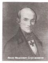
Яков Израильевич Береди́ков Изображение: В. Ф. Ткаченко, галерея «История»

БЕРЕДНИКОВ Яков Иванович (07.10.1793, С.-Петербург - 28.09.1854, Тихвин). Историк, археолог. С 19 октября. 1841 г. адъютант по истории и археологии Отделения русского языка и словесности Петербургской академии наук. С 6 февраля 1847 г. ординарный академик. Работал в Археологической комиссии. Сотрудник БАН с 1835 по 1854 г. - библиотекарь-академик [директор] 1-го (русского) отделения центральной библиотеки Петербургской академии наук.