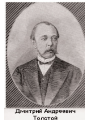
Дмитрий Андреевич Толстой

ТОЛСТОЙ Дмитрий Андреевич (1823, Москва - 1889, С.-Петербург). Государственный деятель. С 1865 г. обер-прокурор Святейшего Синода. С 1866 г. министр и член Государственного совета. 9 декабря 1866 г. избран почетным членом Академии наук. С 25 апреля 1882 по 25 апреля 1889 г президент Петербургской академии наук.