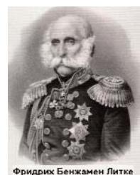
Фридрих Бенжамен Литке

ЛИТКЕ (ЛЮТКЕ) Фридрих Бенжамен, Федор Петрович (Lutke Friedrich Benjamin, 1797, С.-Петербург-1882, С.-Петербург). Мореплаватель, географ. С 16 декабря 1829 г. член-корреспондент Академии, с 1855 г. - почетный член. С 23 февраля 1864 по 25 апреля 1882 г. президент Петербургской академии наук.