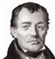
Петр Иванович Соколов

состояния". Сотрудник БАН с 1797 по 1835 г. - унтер-библиотекарь при Библиотеке и Кунсткамере Петербургской академии наук. С 1819 г. по 1835 г. библиотекарь [директор] 1-го (русского) отделения центральной библиотеки Петербургской академии наук. В 1835 г. стал лауреатом Демидовской премии Академии наук по филологии. Был также казначеем, секретарем Комиссии по постройке главного дома Академии и редактором Журнала Департамента народного просвещения. В 1832 г. по поручению президента Академии С.С. Уварова составил: "Каталог обстоятельный Российским рукописным книгам, к российской истории и географии принадлежащим и в Академической библиотеке находящимся" .